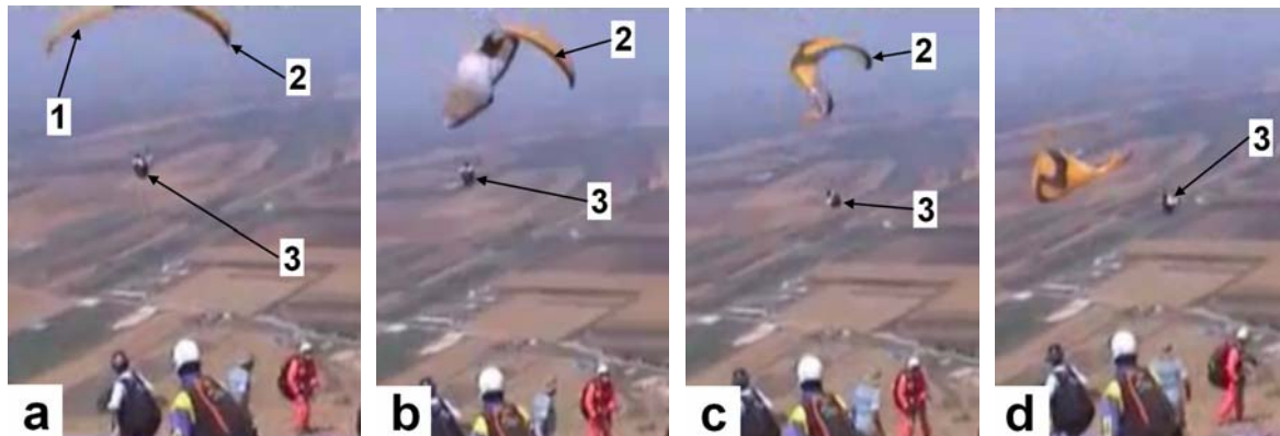
Bildfolge 12 eines echten großflächigen seitlichen Einklappers– a: beginnender Einklapper, b: Ende Geradeausphase, c: Ende Drehphase, d: Ende Vorschießphase; 1 Beginnender Einklapper (linke Kappenseite), 2 Hinterkante der offenen Kappenseite (schwarz), 3 Pilot

Geradeausphase: In der Bildfolge ist zwischen a) und b) kein Wegdrehen der Kappe zur eingeklappten Kappenseite sichtbar obwohl 0,9 Sekunden dazwischen liegen. Der Pilot spürt den Einklapper in dieser Phase schon früh anhand des schnellen Abkippen des Gurtzeugs und dem plötzlich nachlassenden Steuerleinenzug auf der einklappenden Kappenseite. Das Kritische in dieser Phase ist, dass die offene Kappenseite relativ zur umgebenden Luft stark sinkt. Die Phase könnte daher auch gut als Geradeaus- & Sackphase bezeichnet werden. Die Ursache ist plausibel: Die großflächig eingeklappte Kappe hat viel weniger Auftrieb. Also sinken Kappe und Pilot kurzzeitig fast wie ein Stein nach unten (in der Bildfolge ist das schlecht erkennbar, da sich die offene Kappe in einem starken Aufwindbereich befindet; im Video [1] ist der Übergang zum Sinken gut erkennbar). Mit zunehmender Sinkgeschwindigkeit relativ zur umgebenden Luft wird der Anstellwinkel höher und der Auftrieb steigt wieder. Bei einigen Videos kann man zudem auch ein „Hängen bleiben“ der Kappe in der Geradeausphase beobachten. Da hier die Kappe etwas hinter dem Piloten bleibt, führt dies auch zu einem erhöhten Anstellwinkel. Wichtig: Durch diese Effekte ist der Anstellwinkel der offenen Kappenseite in der Geradeausphase ungewohnt hoch.